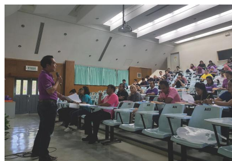
ภาพที่ 6 นำเสนองาน