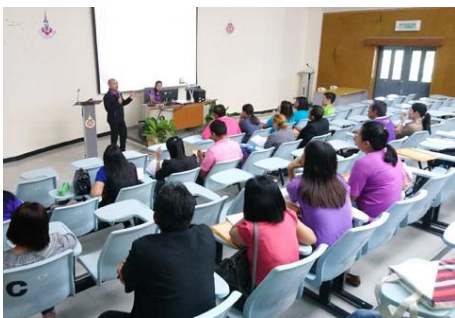
ภาพที่ 3 ช้อแนะนำ โดยวิทยากร อพ.สธ.