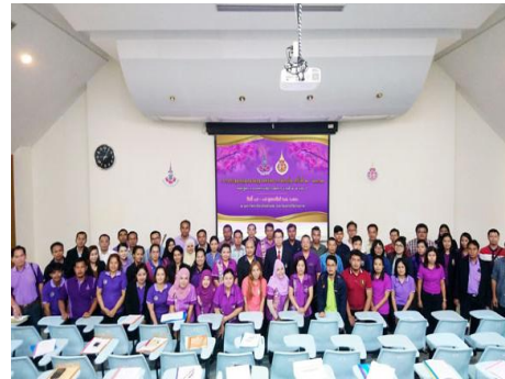
ภาพที่ 2 ผู้เข้าร่วมการฝึกอบรมฯ ถ่ายภาพร่วมกัน