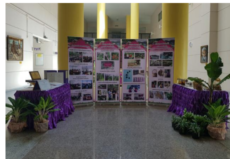
ภาพที่ 4 จัดแสดงนิทรรศการ 3 แห่ง