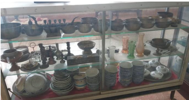
ภาพที่ ๓ การสำรวจเก็บรวบรวมข้อมูลแหล่งโบราณคดี