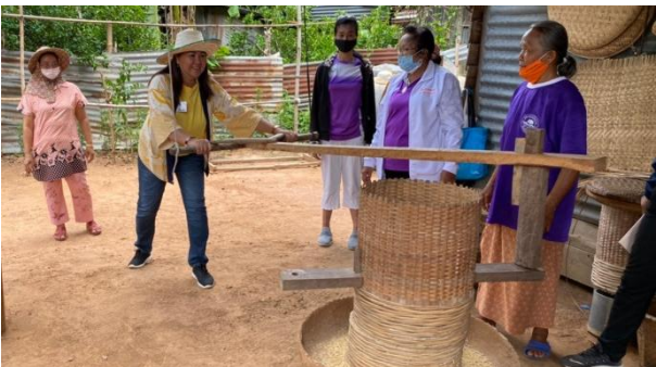
ภาพที่ ๕ การสำรวจเก็บรวบรวมข้อมูลภูมิปัญญาท้องถิ่น