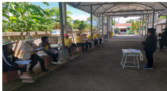
ภาพที่ ๒ การสำรวจเก็บรวบรวมข้อมูลทรัพยากรท้องถิ่น