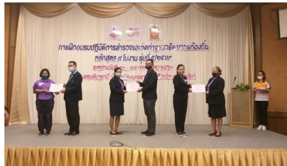
ภาพที่ ๖ พิธีปิดและมอบเกียรติบัตร