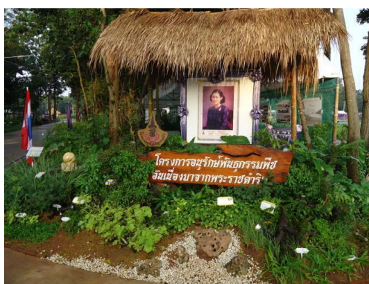
บริเวณด้านหน้าบูธซึ่งจัดแสดงผักพื้นเมืองชนิดต่างๆ