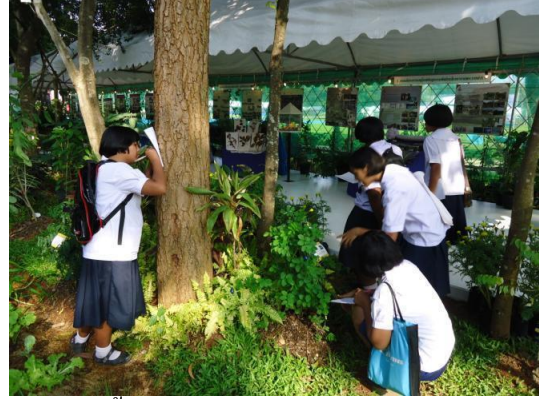
กลุ่มนักเรียนเข้าเยี่ยมชมผักพื้นเมือง