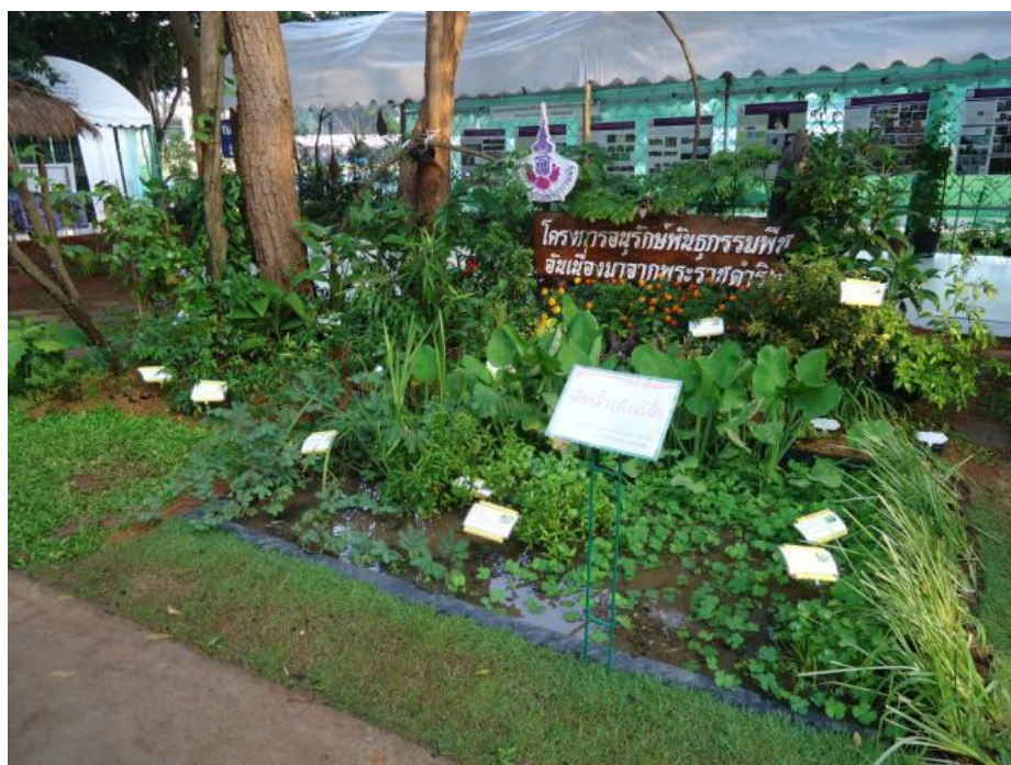
จัดแสดงผักชนิดต่างๆ ที่อาศัยอยู่ในแหล่งน้ำและรอบแหล่งน้ำ