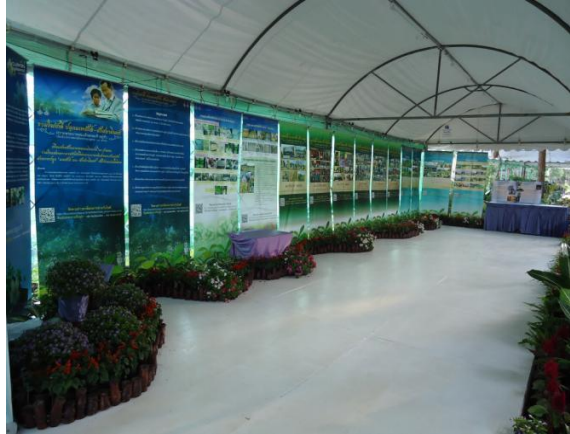
นอกจากนี้ยังมีการประชาสัมพันธ์อนุรักษ์พันธุกรรมพืช สมเด็จพระเทพรัตนราชสุดาฯ สยามบรมราชกุมารี