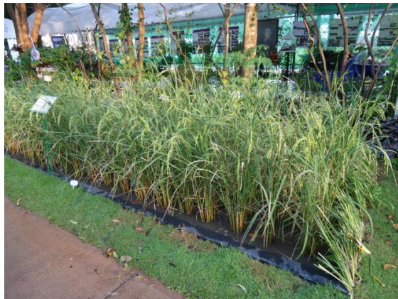
แปลงสาธิตการปลูกผักและข้าว