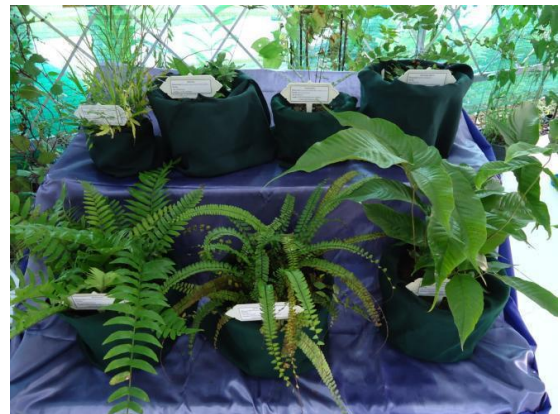
ภายในบูธจัดแสดงพืชบางชนิดที่ปลูกอนุรักษ์ไว้ เช่น เฟิร์น กล้ายไม้ เป็นต้น