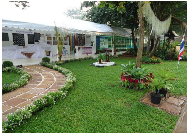
คณะปฏิบัติงานวิทยากร อพ.สธ. ร่วมจัดนิทรรศการ