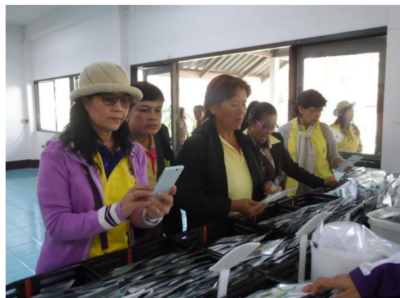
เยี่ยมชมการผลิตชาอินทรีย์ ชิมชา พร้อมทั้งเลือกซื้อผลิตภัณฑ์ชาชนิดต่างๆ