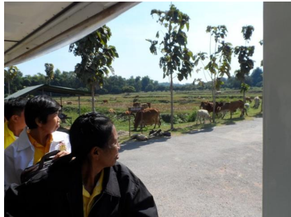
นั่งรถเพื่อเยี่ยมชมตามจุดเรียนรู้ต่างๆ