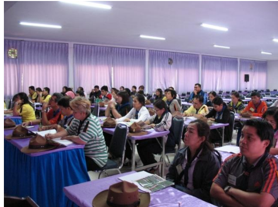
ฟังบรรยายความเป็นมาของโครงการอนุรักษ์พันธุ์กรรมพืชอันเนื่องมาจากพระราชดำริฯ