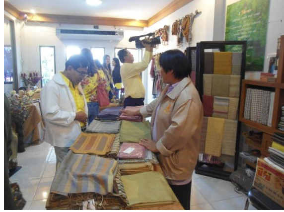
ชมสาธิตการทอผ้าด้วยกี่กระตุก และนิทรรศการการย้อมเส้นไหมด้วยสีธรรมชาติ ภายในอาคารนิทรรศการหยาตป่า พร้อมทั้งเลือกซื้อผลิตภัณฑ์ผ้าไหม