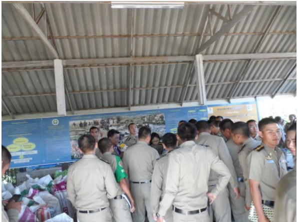
เรียนรู้วิธีการผลิตปุ๋ยหมักชีวภาพแห้ง และวิธีใช้ประโยชน์