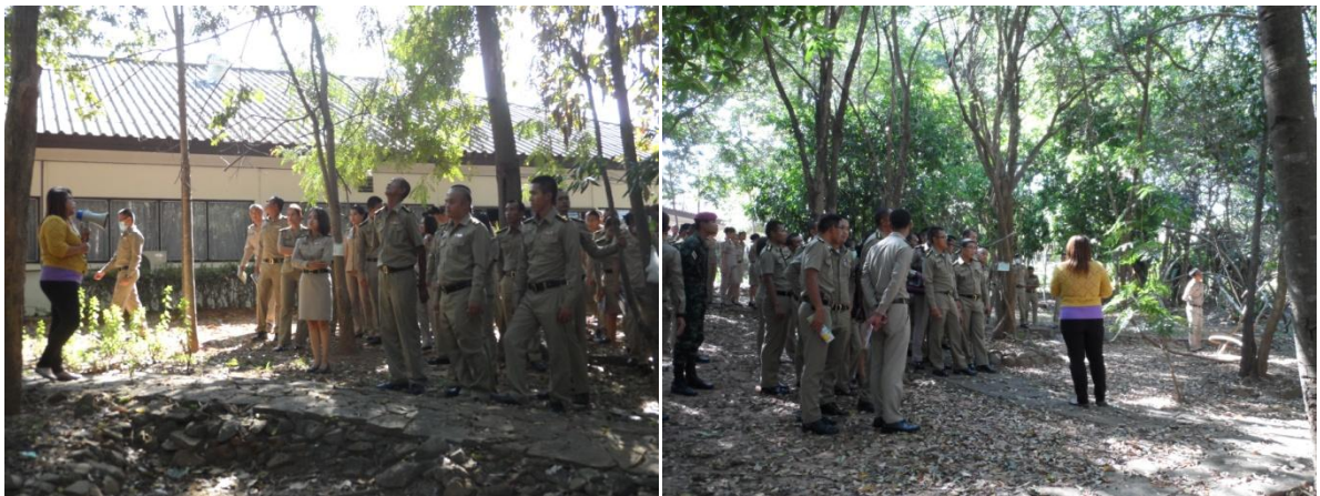
เยี่ยมชมสวนสมุนไพร