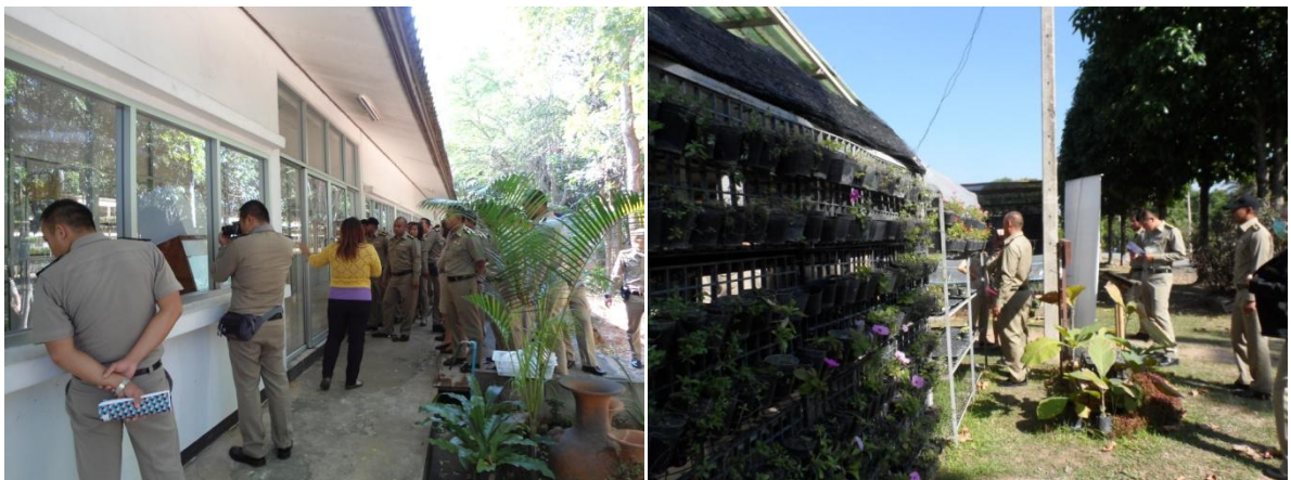
เรียนรู้วิธีการขยายพันธุ์พืชด้วยการเพาะเลี้ยงเนื้อเยื่อ และการนำพืชในขวดเพาะเลี้ยงออกปลูกในสภาพธรรมชาติ