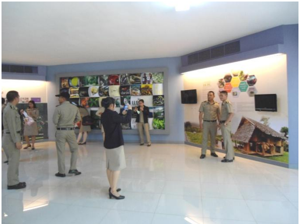
เยี่ยมชมอาคารพิพิธภัณฑ์ อพ.สร.