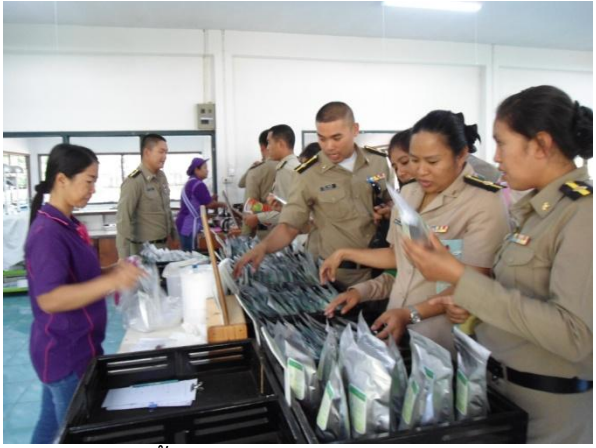
เยี่ยมชมสาธิตการผลิตชาเขียวใบหม่อน ชิม และเลือกซื้อผลิตภัณฑ์ชาชนิดต่างๆ