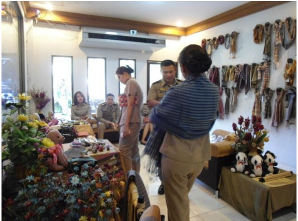
เยี่ยมชมนิทรรศการการย้อมสีเส้นไหมด้วยวัสดุธรรมชาติ และผลิตภัณฑ์ผ้าไหมภายในร้านหยาดป่า