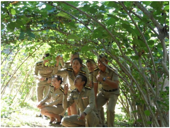
เรียนรู้ รู้จัก สัมผัสกับผักพื้นเมืองหลากหลายชนิด